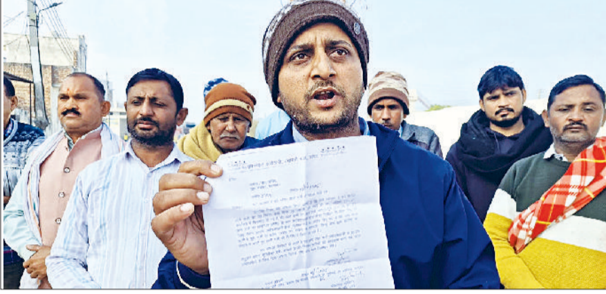
दंड। रोष जताते पबनावा के ग्रामीण।