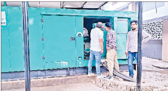
जींद। अस्पताल में रखे जनरेटर सेट की जांच करते हुए कर्मचारी।

जिला मुख्यालय स्थित नागरिक अस्पताल में जाने कब लाइट चली जाए और इमरजेंसी सेवाएं प्रभावित हो जाएं। हालांकि अस्पताल में बड़ा जनरेटर सेट है। जो अस्पताल का लोड उठासकता है लेकिन इस जनरेटर सेट की सर्विस नहीं होने के कारण कई बार बिजली की समस्या पैदा हो जाती है। जनरेटर सेट को ठीक करवाने तथा इसकी वार्षिक मरम्मत के लिए अस्पताल प्रशासन के पास बजट नहीं था। अब लोन