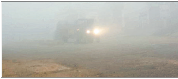
कैथल। सुबह के समय छाया कोहरा।

धुंध के चलते लगातार रेलगाड़ियां हो रही लेट, यात्री परेशान