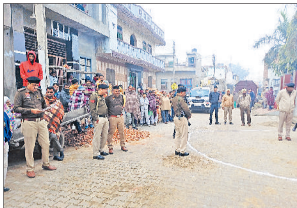
पूंडरी। कारवाई करती पुलिस।

पुलिस ने किया निरीक्षण, गांव और आसपास के इलाकों में नाकाबंदी